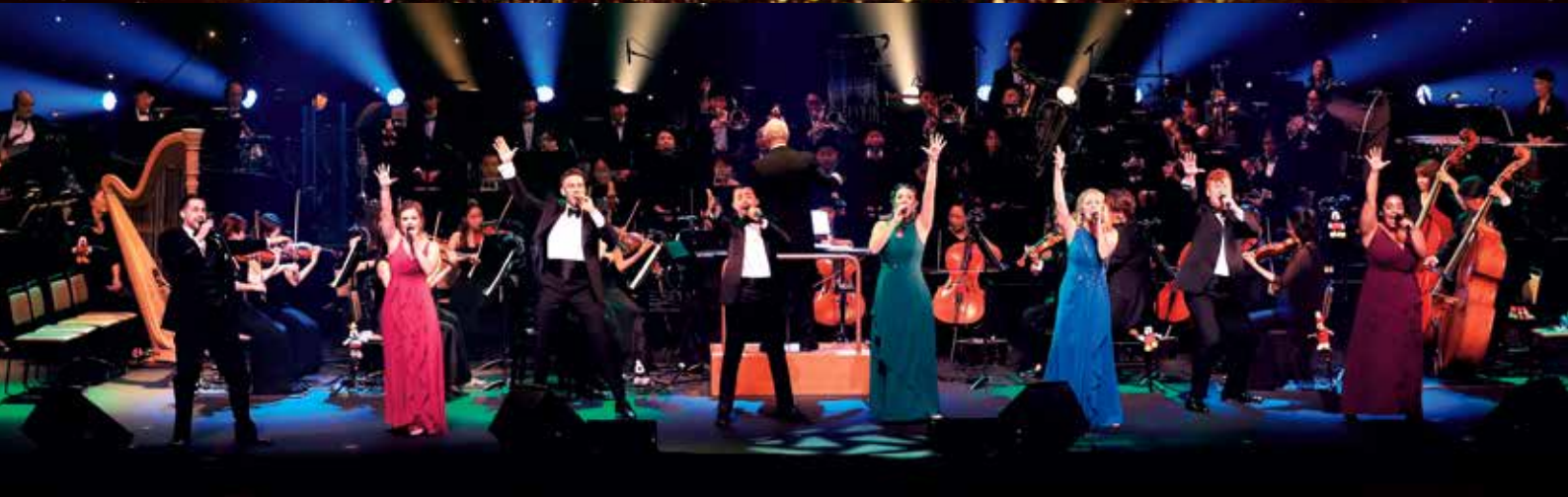
※ステージ写真は過去の公演です