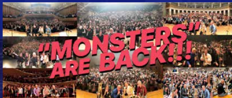
2018年に開催された全国ツアーでは「スラモン旋風」を巻き起こした

世界トップのトロンボーン・プレイヤーが集結！ 2018年、デビューツアーで「スラモン旋風」を巻き起こした「スライド・モンスタース」。 トロンボーン4本という最もシンプルな編成ながら、卓越したテクニックで聴衆を魅了する。 クラシックやジャズなどジャンルの垣根を超えた至極のアンサンブルをお聴き逃しなく！！