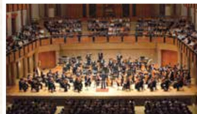
佐渡裕指揮 新日本フィルハーモニー交響楽団50周年記念演奏会