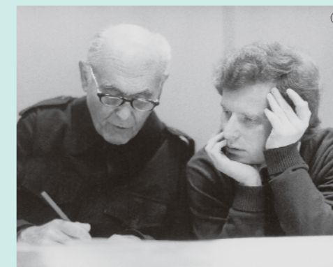
同じハンガリー出身で20世紀を代表する名指揮者サー・ゲオルグ・ショルティとも共演を果たした