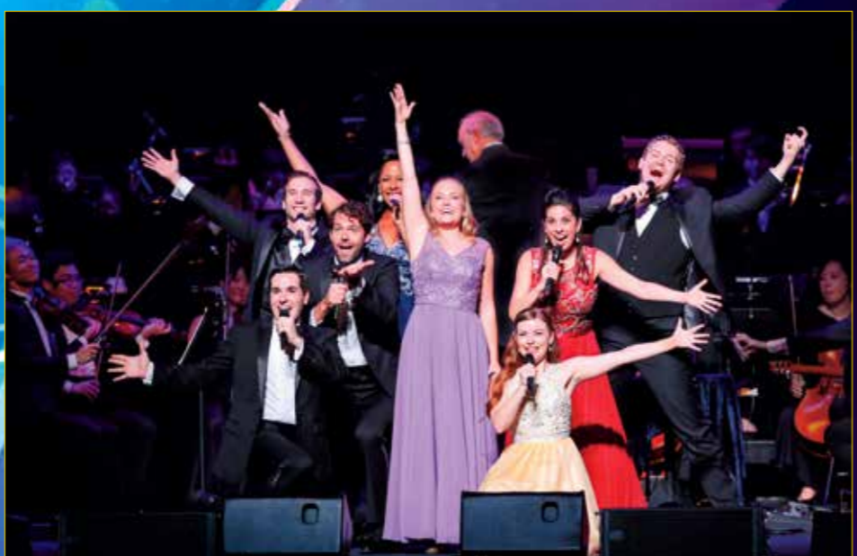
※ステージ写真は過去の公演です