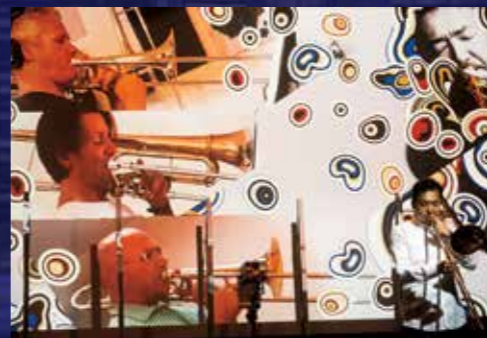
2021年10月に「Hitori Monsters」をオンライン配信メンバーは入国制限で来日出来なかったが収録で参加した