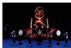
鼓童ワン・アース・ツアー