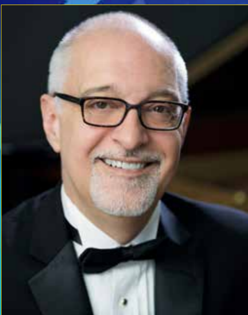
リチャード・カーシー [指揮]

ディズニー・オン・クラシック初演（2002年）から指揮を務めたブラッド・ケリーの後任として所沢ミュージックに初登場するのが指揮者のリチャード・カーシー。ディズニー音楽のみならず、ブロードウェイなどあらゆる劇場音楽を知り尽くしたスペシャリストです。ディズニー音楽への溢れんばかりの愛と、突き抜けた表現力で観客を魅了するオーケストラ・ジャパンの壮大なサウンドに加え、歌手陣は並みいる名歌手の中から選ばれたブロードウェイで活躍する一流のヴォーカリストたち。超一流の指揮者・オーケストラ・歌手が三位一体となった極上の演奏を、美しい響きを誇る所沢ミュージックのアークホールでお楽しみください。