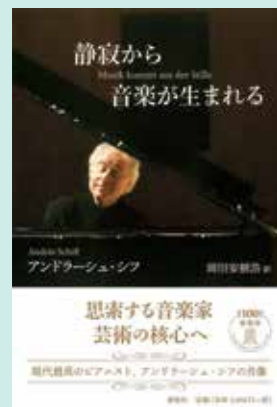
近著「静寂から音楽が生まれる」にはシフの信念と深い音楽哲学が綴られる

だが、どれもシフがデビュー以来50年にわたり磨き抜き徹底的に深めてきた作曲家ばかり。モーツァルトはシフがDECCAへのデビューを飾りピアノ・ソナタ全集を完成させたいわば原点。ベートーヴェンもまたピアノ・ソナタ全曲演奏を20都市以上で行うなど、もはやライヴワーク。同様にシューベルトもピアノ・ソナタ全集(DECCA)に取り組み、歌曲の分野でも20世紀を代表する名歌手ディートリヒ・フィッシャー・ディースカウやペーター・シュライアーと共演するなど、限らない愛情を注いできた作曲家だ。使用楽器も現時点では、ウィーンの名器ベーゼンドルファーを弾くか、スタインウェイを弾くか決定していないが、いずれにしても円熟の時を迎えた巨匠シフにしか成し得ない究極のピアノ芸術を聴かせてくれるだろう。