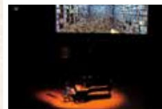
アリス=紗良・オット