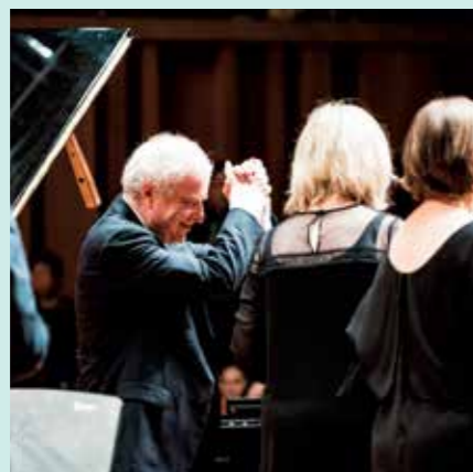
自ら創設した室内オーケストラ「カペラ・アンドレア・バルカ」とは弾き振りでも絶賛をあげる