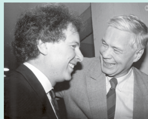
名歌手ディートリヒ・フィッシャー=ディースカウと。シューベルトの歌曲にも情熱を注ぐ