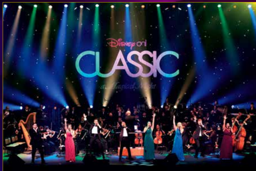
※ステージ写真は過去の公演です

オープニングを飾るのは東京ディズニーランド®「ディズニーファンタジーリユニオン」より「フェアリーランド」で知られていた華やかで幻想的な光のパレードのオープニング曲。ほかにも『メリー・ポピンズ』の魅力がギュッと詰まった『メリー・ポピンズ』組曲や、人気のディズニー映画やテーマパークの音楽から、その日に演奏する曲を会場のお客様と一緒に「ルーレット」でディズニーの世界観を存分に味わいましょう！