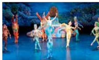
NBA バレエ団「リトルマーメイド」