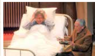
加藤健一事務所「サンシャイン・ボーイズ」