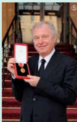
2014年にエリザベス女王の誕生日に際しイギリスからナイトの爵位を授与される