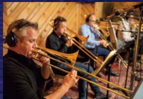
アルバムは2020年NYでレコーディングされた

※未就学児の入場はご遠慮ください。 ※新型コロナウイルスの感染状況により、公演の中止の可能性がございます。 最新情報は所沢ミュージズ公式ホームページでご確認ください。