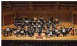
ぼんだウインドオーケストラ