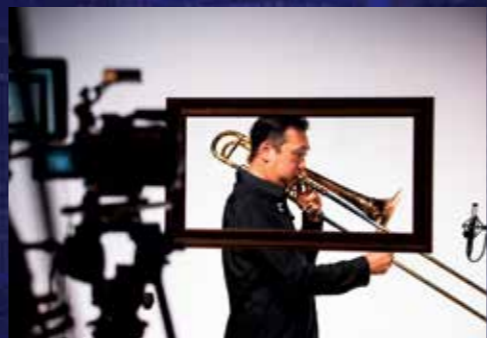
中川英二郎は2022年、演奏活動40周年＆メジャーデビュー30周年の記念イヤーを迎えた