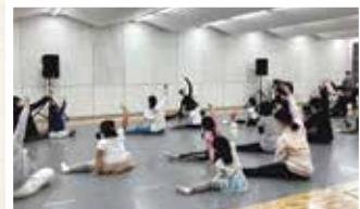
はじめてのバレエ体験