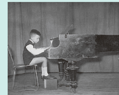
幼少期のシフ。5歳でピアノをはじめヨーロッパ屈指の名門リスト音楽院で学んだ

写真出典 ①～④アンドラーシュ・シフ 著/岡田安樹浩 訳「静寂から音楽が生まれる」春秋社 より ⑤ Askonas Holtウェブサイト より