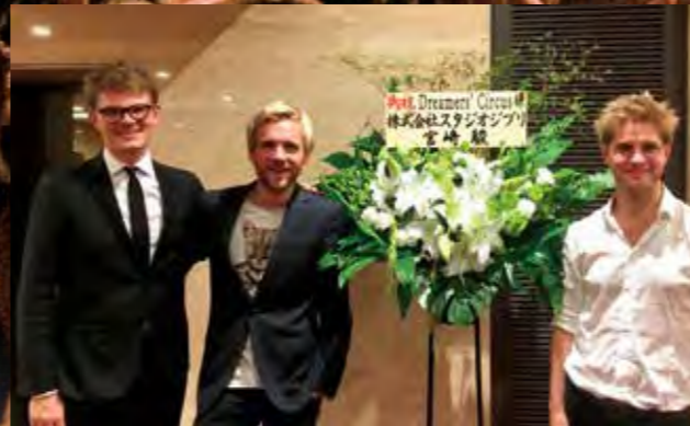
スタジオジブリの宮崎駿 監督とも親交があり、ライブに花束を贈ってくれたことも