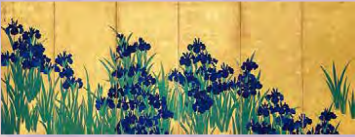
尾形光琳による屏風「燕子花図(かきつばた)」(1701-02年)伊勢物語の一場面を描いた