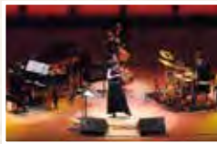
寺井尚子コンサート2022