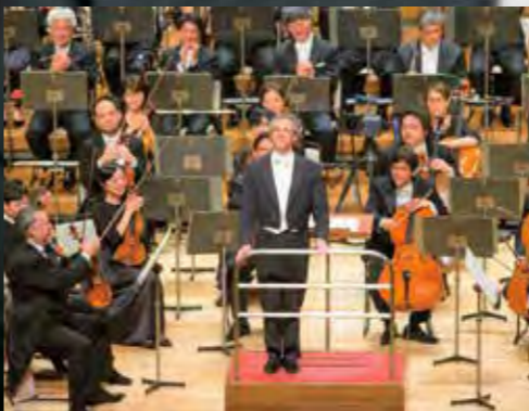
N響と共演を重ね2017年のマラー: 交響曲第1番で名演を残した