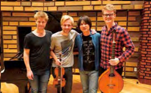
プレイステーション用ゲーム『クロノ・クロス』の音楽を手掛ける光田康典とレコーディングを行った

デンマークが生んだ奇跡のトリオが5年ぶりに所沢ミュージズに帰ってくる！驚異のテクニックを持つ3人の演奏と、デンマークの伝統音楽とクラシック音楽が融合した新たなサウンドをご堪能ください！