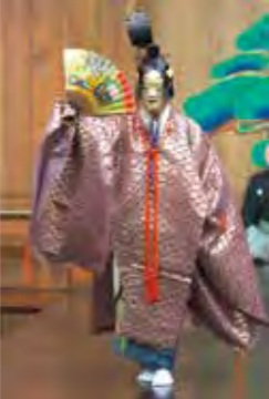
夜になり、在原業平の冠と二条の後の唐衣を身につけて現れる