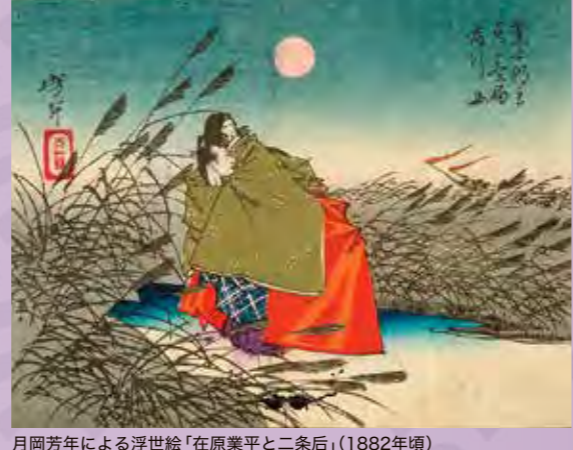
月岡芳年による浮世絵「在原業平と二条后」(1882年頃)