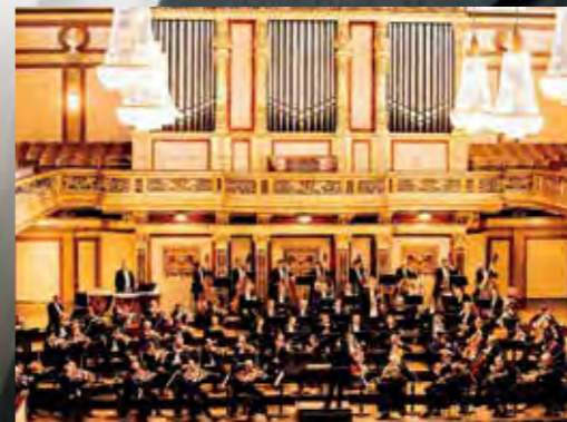
ウィーン響の首席指揮者を務め、ウィーン国立歌劇場でも絶賛を浴びた