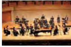
ジャパン・ナショナル・オーケストラ

〈アークホール〉 曲目 / メンデルスゾーン: ヴァイオリン協奏曲 ホ短調 Op.64 ショパン: ピアノ協奏曲第1番 ホ短調 Op.11