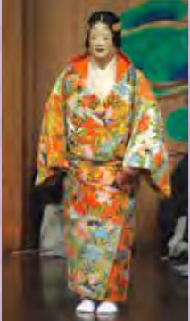
沢で出会った時の女の姿