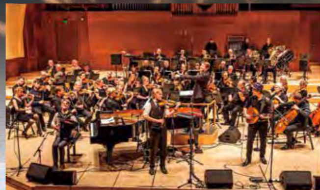
北欧屈指の名門コペンハーゲン・フィルと夢の共演を果たす