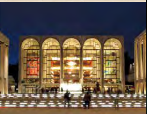
メトロポリタン歌劇場ではイタリア・オペラ、ドイツ・オペラの両面で高い評価を得た