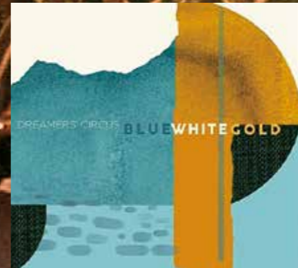
最新アルバムには親交を深める宮崎駿監督に捧げた『ワルツ・フォー・ミヤザキ』を収録