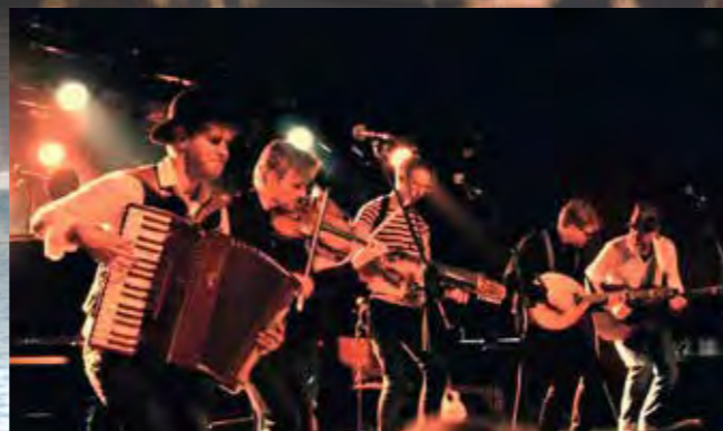
スウェーデンが生んだ世界的バンド(ヴェーセン)とも共演