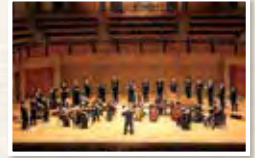
バッハ・コレギウム・ジャパン

曲目 / J.S. バッハ 3台のチェンバロのための協奏曲 第1番 二短調 BWV1063 3台のチェンバロのための協奏曲 第2番 ハ長調 BWV1064 ほか