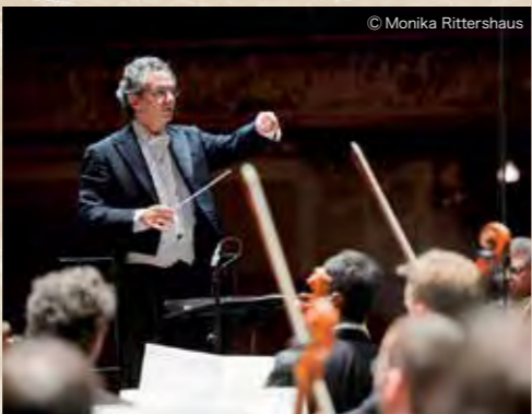
フィルハーモニア・チューリッヒでは交響曲指揮者としても名声を確立した