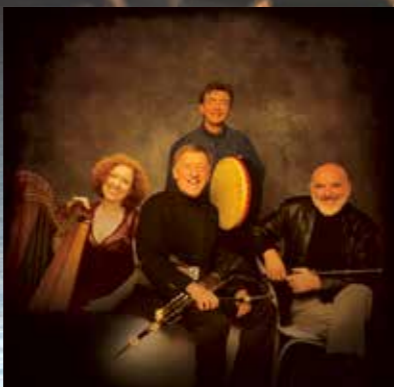
アイルランドの伝説のバンド(チーフタンズ)とも共演を果たした