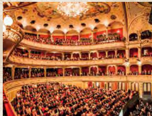
ヨーロッパの最高峰の1つチューリッヒ歌劇場では9年にわたり音楽総監督を務めた

※未就学児の入場はご遠慮ください。 ※新型コロナウイルスの感染状況により公演中止の可能性がございます。最新情報は所沢ミュージズの公式ホームページでご確認ください。