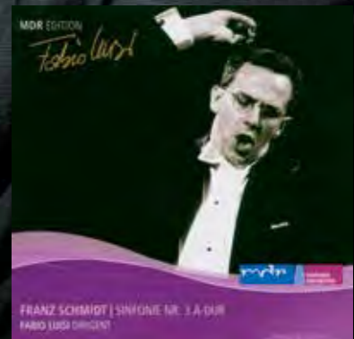
ライプツィヒ放送響時代に多くの名盤を残し、所沢ミュージズにも出演した