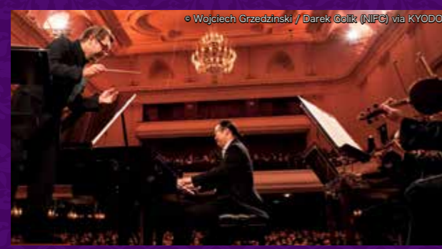
2005年から憧れ続けた夢舞台、ショパン・コンクールのファイナルは最高に幸せな時間だった