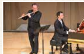
エマニュエル・パユ [フルート] バンジャマン・アラール [チェンバロ]

エマニュエル・パユ [フルート] バンジャマン・アラール [チェンバロ] (マーキーホール) 曲目/J.S. バッハ: フルート・ソナタ J.S. バッハ: 無伴奏 フルートのためのパ ルティータ ほか