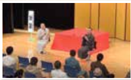
番外・所沢寄席 中央亭