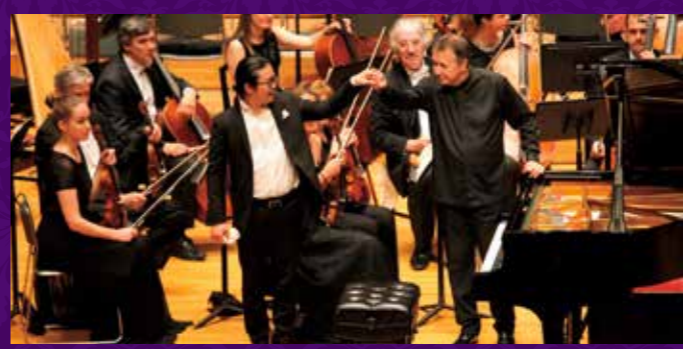
巨匠プレトニョフの指揮でロシア・ナショナル管と共演、白熱の演奏でアークホールの聴衆を沸かせた