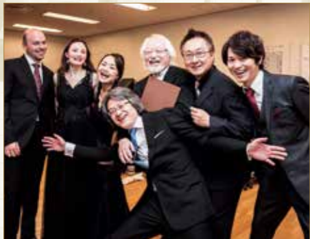
2018年にBCJの首席指揮者に就任した鈴木優人と共にバッハ演奏を牽引し世界の注目を集めている

3月20日(日) 14:15 開場 15:00 開演 アークホール 好評発売中 料金◆全席指定 S席: ¥6,500 A席: ¥5,500 学生席[25歳以下]: ¥4,000 曲目◆3台のチェンバロ協奏曲 第1番 二短調 BWV 1063 4台のチェンバロ協奏曲 イ短調 BWV 1065 カンタータ第30番 BWV30 ほか ※未就学児の入場はご遠慮ください。 ※新型コロナウイルスの感染状況により公演中止の可能性がございます。最新情報は所沢ミュージズの公式ホームページでご確認ください。