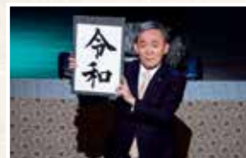
ザ・ニュースペーパー in 所沢