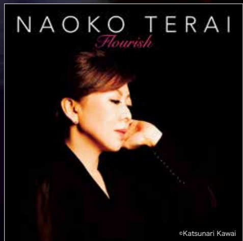
最新アルバム「フロリッシュ」。信頼できるミュージシャンたちと収録したドラマティックで色彩的な自信作