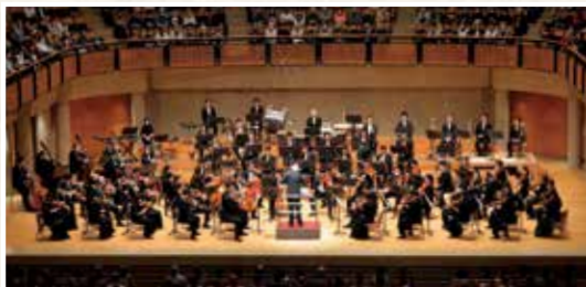
NHK 交響楽団 & ヘルベルト・ブロムシュテット [指揮]

NHK 交響楽団 & ヘルベルト・ブロムシュテット [指揮] 《運命》 (アークホール) 曲目/ステンハンマル: セレナード ベートーヴェン: 交響曲第5番 《運命》