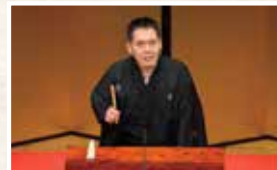
所沢寄席 神田伯山独演会