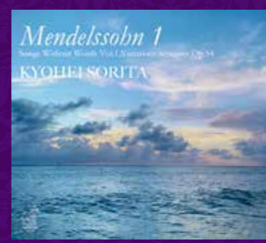
2020年所沢ミュージズでレコーディングしたメンデルスゾーンは鮮烈な演奏で絶賛を浴びた