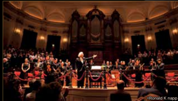
アムステルダムのコンセルトヘボウ公演でもスタンディング・オベーションの喝采を受けた