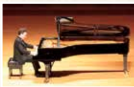
エフゲニー・キーシン [ピアノ]

エフゲニー・キーシン [ピアノ] (アークホール) 曲目/ベートーヴェン: ピアノ・ソナタ第31番 ショパン: アンダンテ・スピナート と華麗なる大ポロネーズ ほか