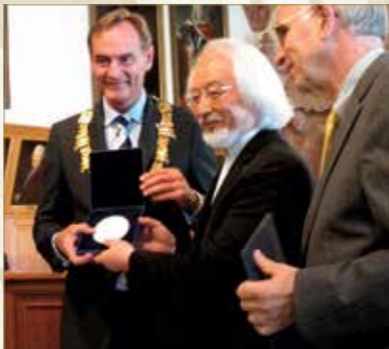
2012年にはライブツィヒ市より、世界的に榮譽あるバッハ・メダルを受賞した