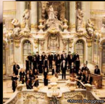
ドレスデン聖母教会など歴史的な教会でも演奏し絶賛を浴びている