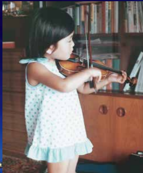
ヴァイオリンを習いはじめた幼少期。「ヴァイオリンを買って欲しい」との母の願いと共に4歳からお稽古をスタート