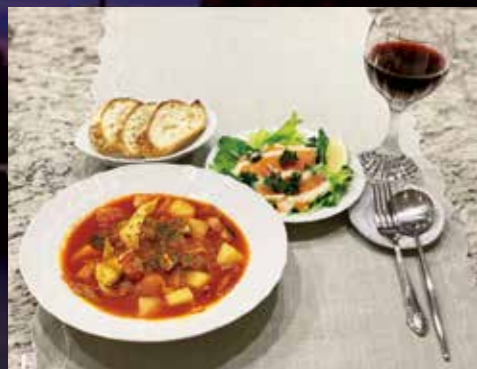
「おうち時間を楽しく！」とお料理にも挑戦。ポルシチ風ディナーとスモークサーモンのサラダ