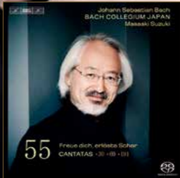
全55集におよぶバッハの教会カンタータの全曲録音は歴史に残る偉業と絶賛された