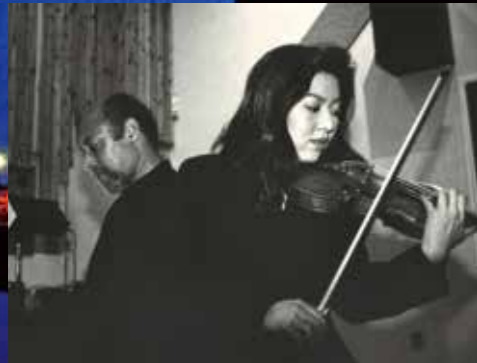
ジャズの巨匠ケニー・バロン[ピアノ]さんのレコーディングに参加ニューヨークでの収録は飛躍の大きなきっかけとなった