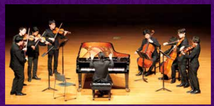
所沢ミュージズでのMLMダブル・カルテット公演では鮮やかな弾き振りを披露