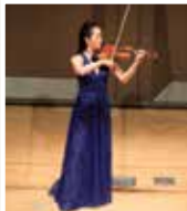
無伴奏ヴァイオリン・リサイタル

諏訪内晶子 無伴奏ヴァイオリン・リサイタル (マーキーホール) 曲目/J.S. バッハ: 無伴奏ヴァイオリン・ソナタ 第1番 無伴奏ヴァイオリン・パルティータ 第1・2・3番 ほか