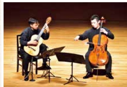
宮田大 [チェロ] & 大萩康司 [ギター]