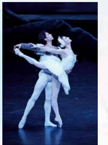
『白鳥の湖』コジョカル & コルネホの主演で絶賛を浴びた