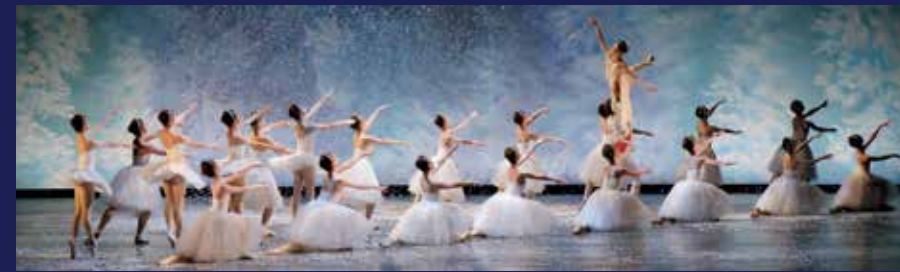
夢と幸せに溢れる NBA バレエ団の『くるみ割り人形』

久保絢一演出による「くるみ割り人形」の最大の特徴の一つは、プロジェクト・マッピング。国内のバレエ作品の中でプロジェクト・マッピングが導入されたのはこれが初めてで、特にパーティーからバトルシーンに発展するまでの舞台効果は絶大。物語の雰囲気や途切れないスピーディーな舞台展開を見せる。