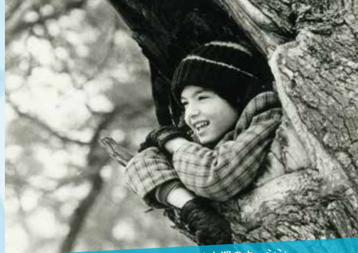
雪のモスクワで遊ぶ幼少期のキーシン