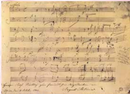
ピアノ・ソナタ第32番の第1楽章冒頭の自筆楽譜 [1822年]