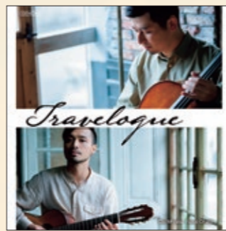
初の共演アルバム

美しい響きと繊細な抒情で聴衆を魅了 2000年のデビュー以来、20年にわたり日本のギター界をリードし続ける大萩康司。その魅力は何といっても自然体で飾らない音楽と人柄にある。世界最難関と言われるコンクールで2位という快挙を成し遂げてもたゆまぬ研鑽を重ね、またホテルオーケラ音楽賞、出光音楽賞という名誉ある賞を受賞しても、じっくり誠実に音楽に向き合い続