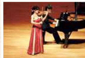
千住真理子 [ヴァイオリン]