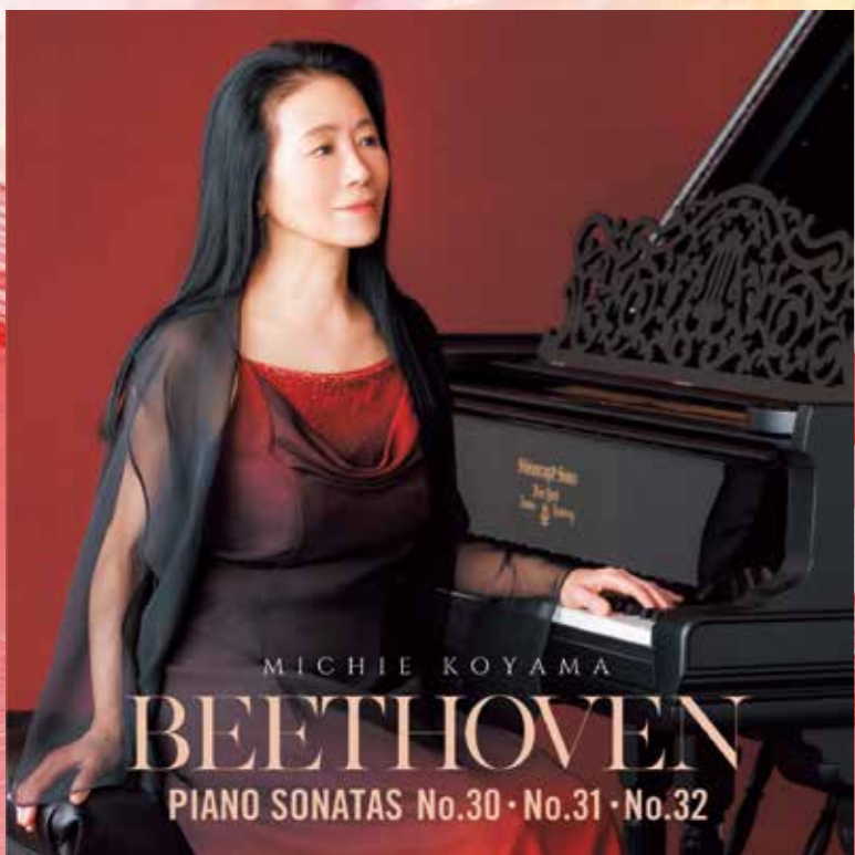
ベートーヴェン・アルバム第2弾《後期三大ソナタ》[6月16日発売]