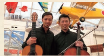
所沢ミュージズに隣接する航空発祥記念館でテレビ収録を行った

溢れるような歌心とストラディヴァリの深い音色 世界最高峰のコンクールで優勝を果たし、小澤征爾などの世界的指揮者と共演を重ね、日本を代表するチェリストとして注目を集めても、宮田大の音楽に対する真摯な態度はまったく変わることがない。常に作品の本質を見つめ、共演者を尊重しながら丁寧に音楽を紡ぎ、サイン会でもファンを大切に丁寧な姿勢は、見事に演奏に反映されている。