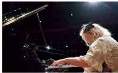
フジコ・ヘミング [ピアノ]

所沢ミュージズでは3年ぶりの登場となったフジコ・ヘミング。今回はN響メンバーによる室内オーケストラとの共演で慈愛溢れる名曲の数々を聴かせてくれました。リスト: ラ・カンパネラにはひときわ熱い拍手が贈られ、そのチャームな人柄とトークでも客席を魅了しました。