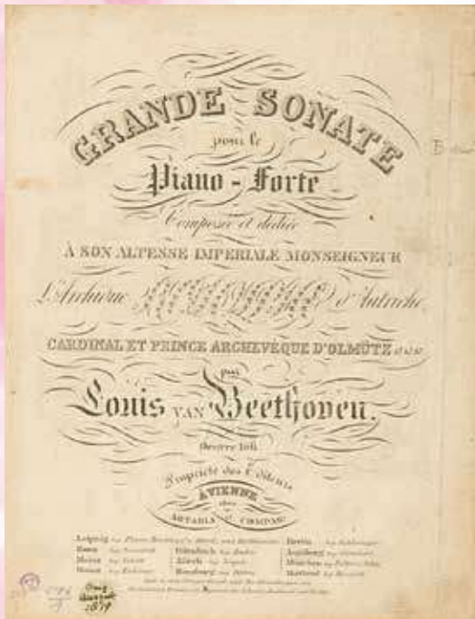
「ハンマークラヴィーア」の初版楽譜の表紙 [1819年]