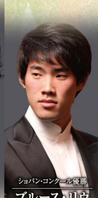
ショパン・コンクール優勝 ブルース・リウ [ピアノ]