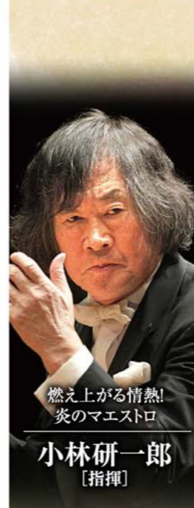
燃え上がる情熱! 炎のマエストロ 小林研一郎 [指揮]