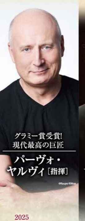
グラミー賞受賞! 現代最高の巨匠 パーヴォ・ヤルヴィ [指揮]