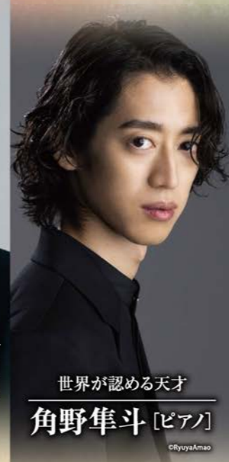
世界が認める天才 角野隼斗 [ピアノ]