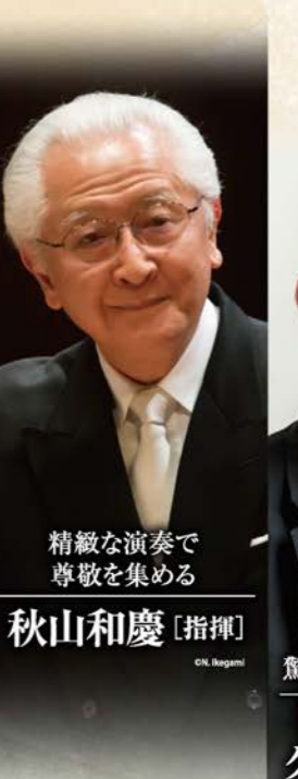
精緻な演奏で 尊敬を集める 秋山和慶 [指揮]