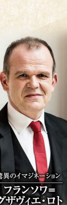
驚異のイマジネーション フランソワ=グザヴィエ・ロト [指揮]