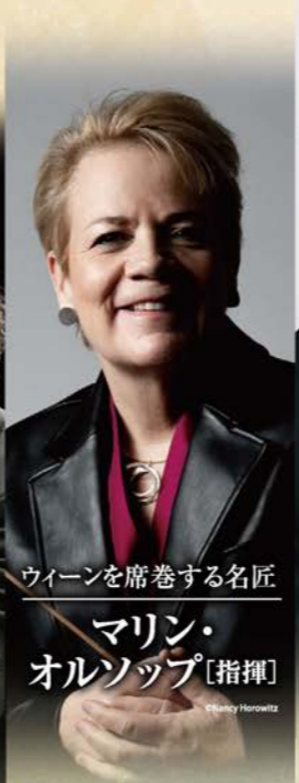
ウィーンを席卷する名匠 マリン・オルソップ [指揮]