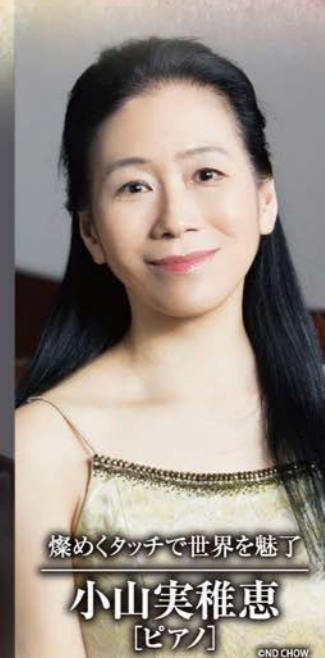
燦めくタッチで世界を魅了 小山実稚恵 [ピアノ]