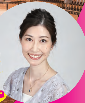
はらだ まゆ オルガニスト 原田真侑