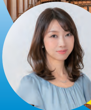
いしまる ゆか オルガニスト 石丸由佳